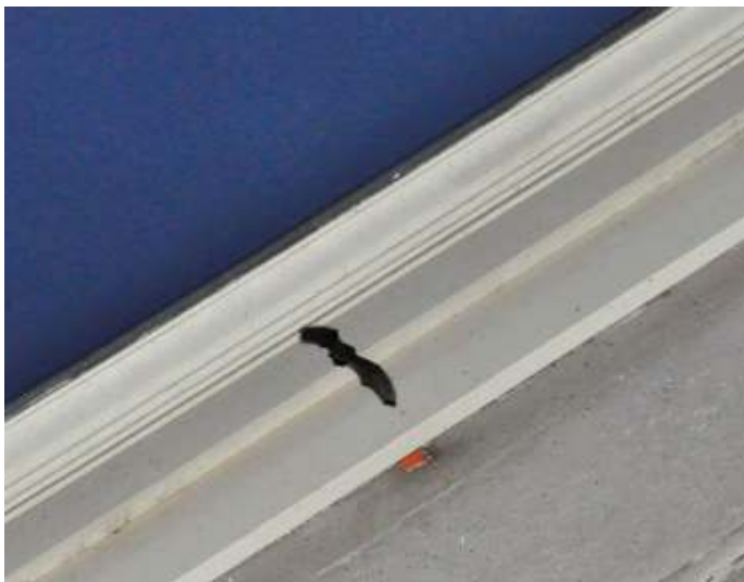
Vleermuis