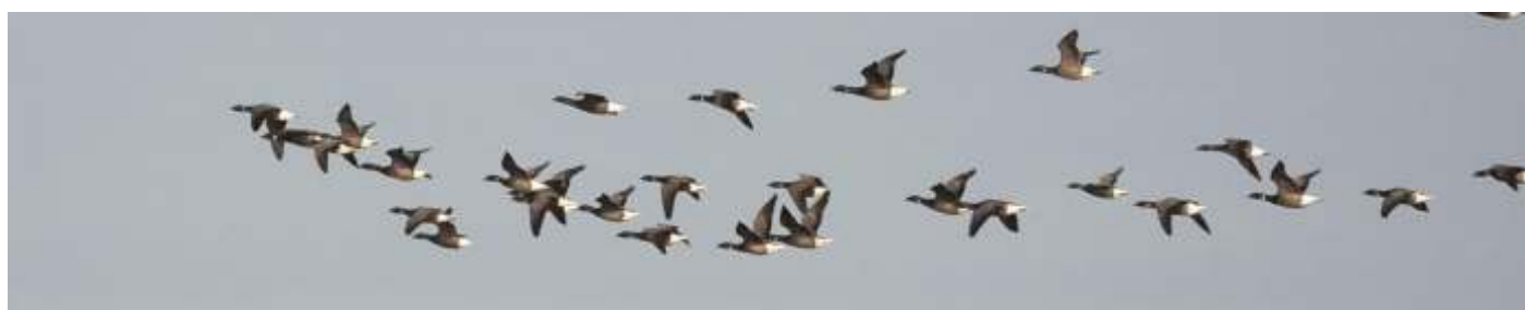
Rotgans, foto: Douwe Greydanus