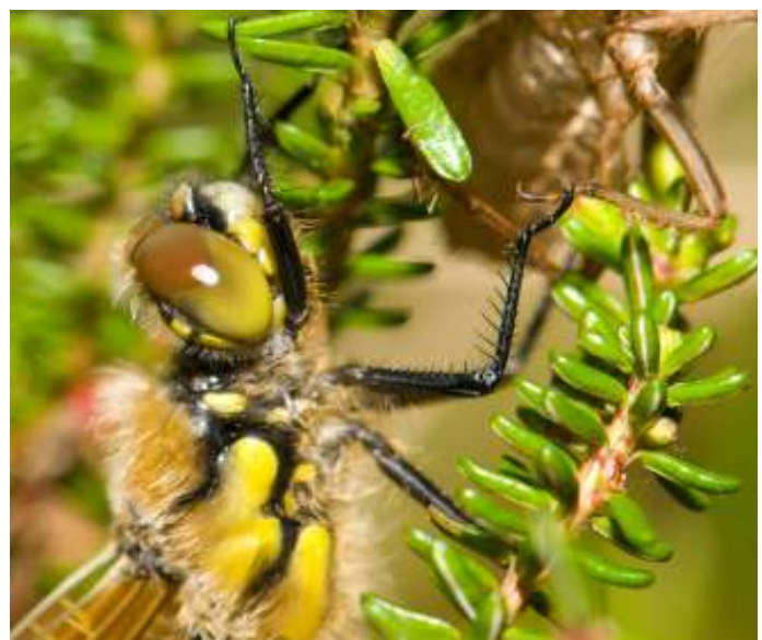
Close-up van de kop van een libelle