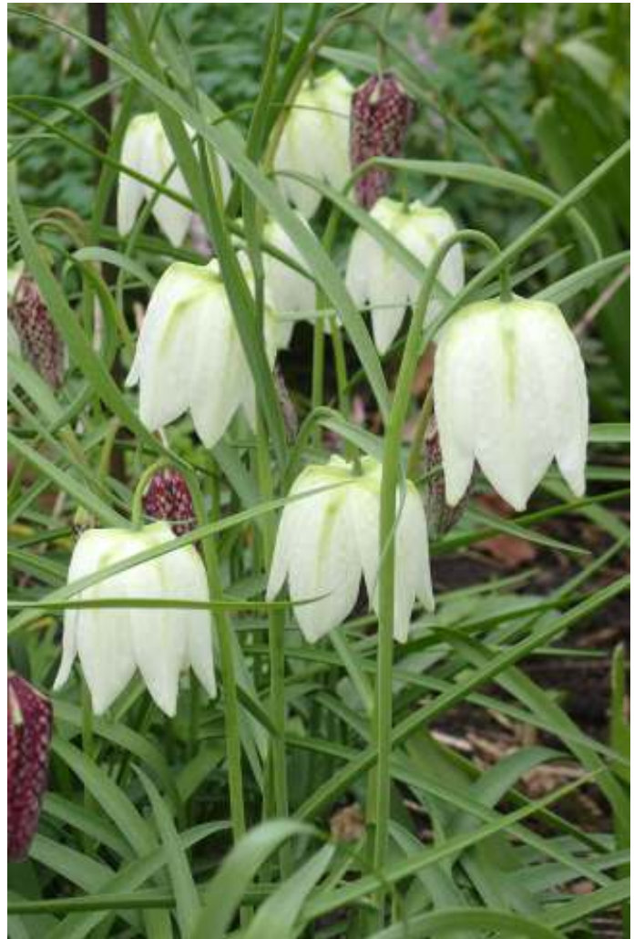
Wilde kievitsbloem, foto: Clemens Appelman