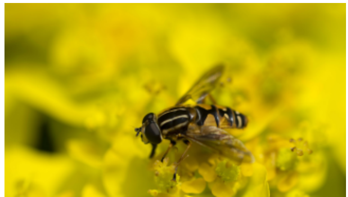
Gewone pendelvlies, foto: Henny van der Groep