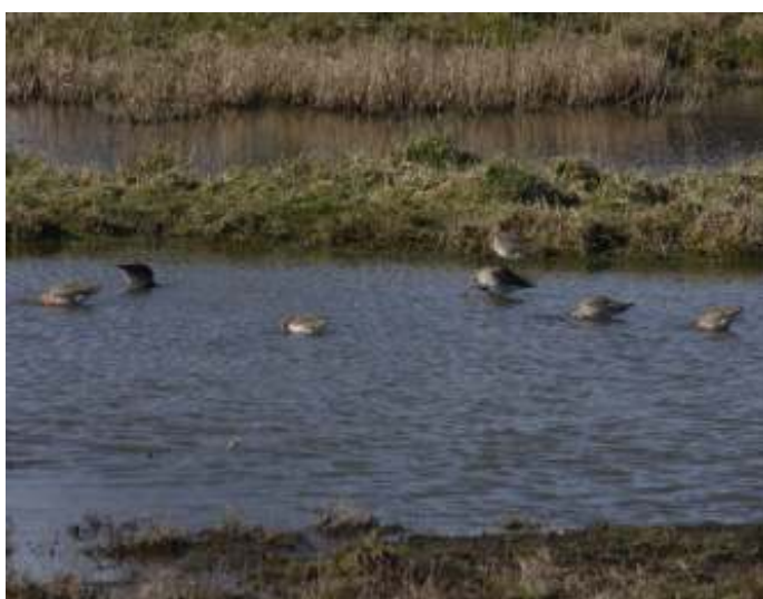
De eerste Grutto's op het landje van Naber