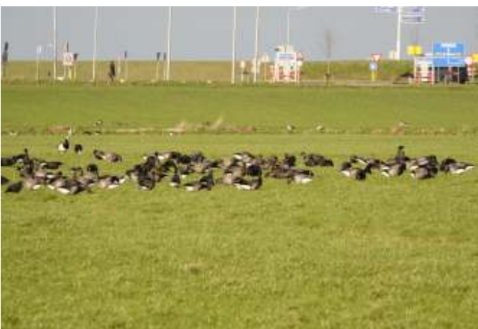
Zwarte rotgans