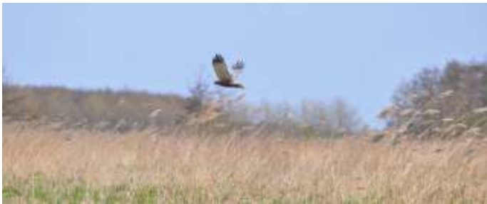
Bruine kiekendief (man)

Inlichtingen: Fred Weel, M: 06 48 66 40 25, E: fredweelroop@ziggo.nl