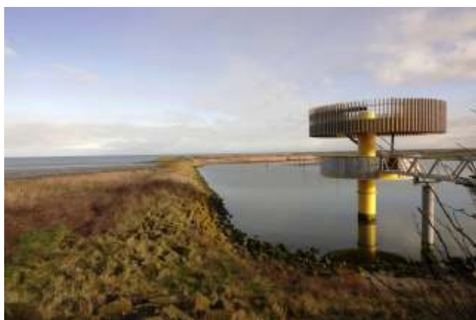
Uitkijktoren den Oever