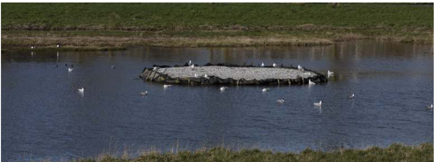
Kokmeeuwen op het landje van Naber