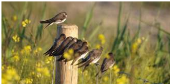
Overzwaluwen, foto: Tineke Horstman - Kooiman

In mei en juni op de tweede donderdag van de maand gaan wij als vogelwerkgroep er op uit. Donderdag 11 mei gaan wij naar de Zeevang verzamelen om 19:30 uur op de parkeerplaats de Hulk aan de Zesstedenweg.