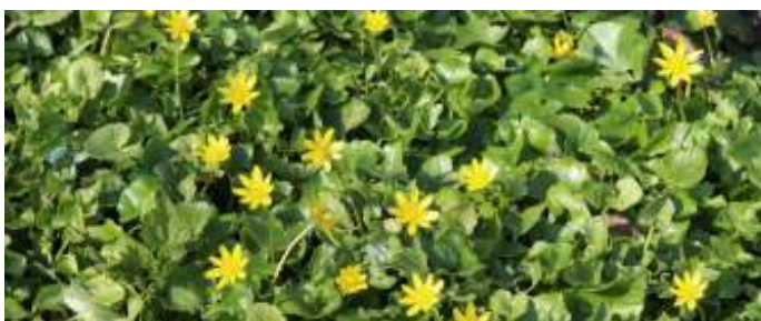
Speenkruid, foto: Roel Kemmers

We starten ter plekke om ±14:30 uur. Ga je per OV; bus 136 uit Hoorn, uitstappen halte Korteling.