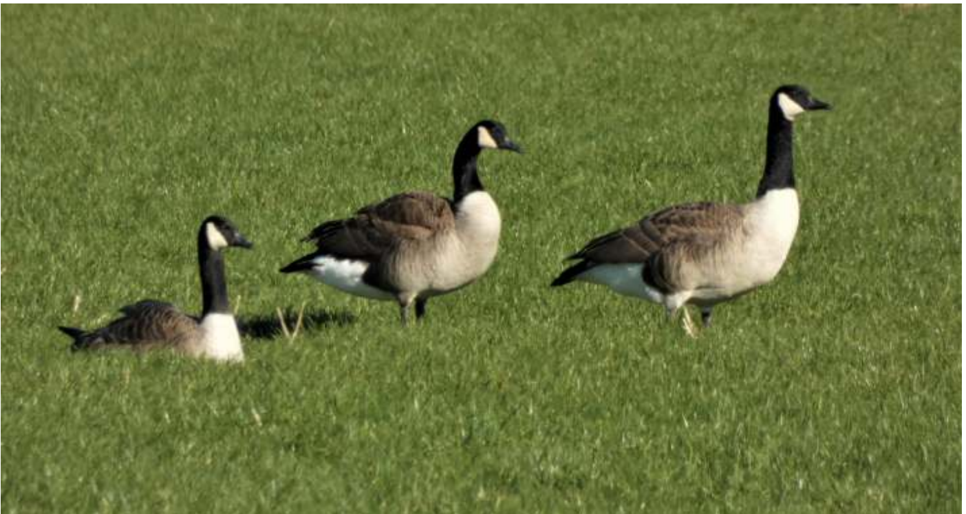
Canadese ganzen