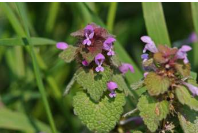
Paarse dovenetel, foto: Ruud Timmer