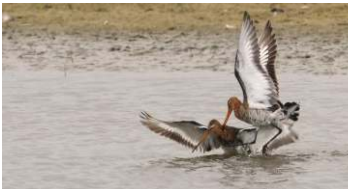
Grutto's, foto: Ilse Schouten