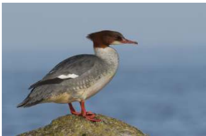
Grote zaagbek, foto: Ilse Schouten