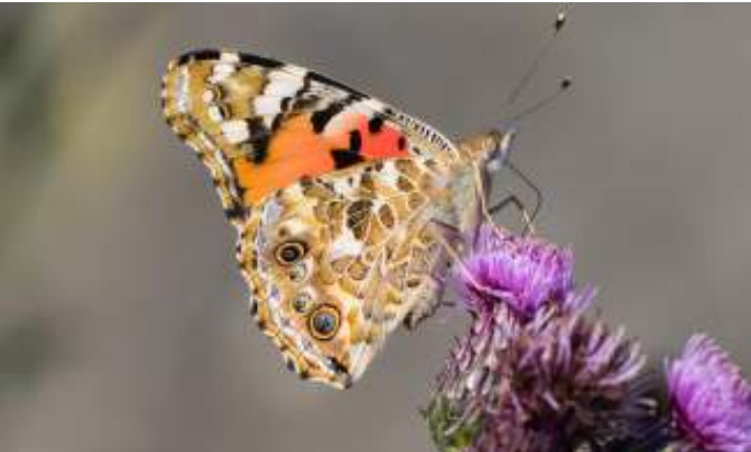
Distelvlinder, foto: Ruud Timmer

KNNV en IVN hebben afgesproken dat leden van beide verenigingen gratis gebruik mogen maken van elkaars activiteiten (tenzij anders vermeld). De activiteiten van de KNNV vindt je op de website hoorn.knnv.nl/agenda en die van het IVN op de website www.ivn.nl/afdeling/west-friesland/activiteiten .