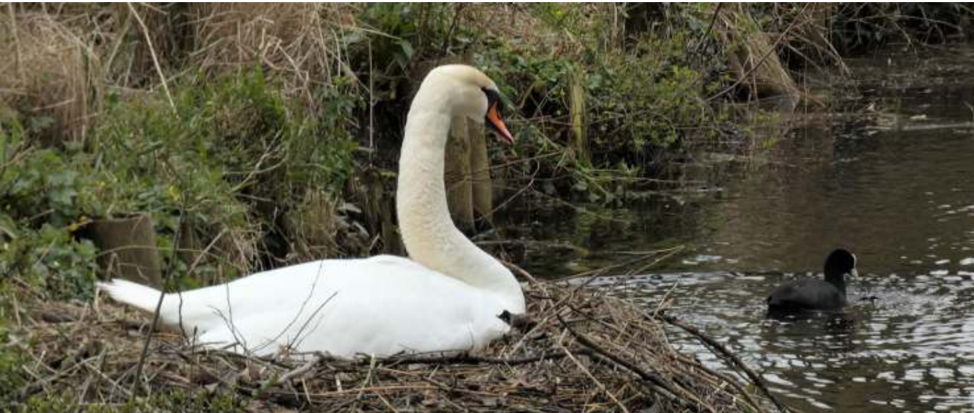
Knobbelzwaan in Wilhelminapark