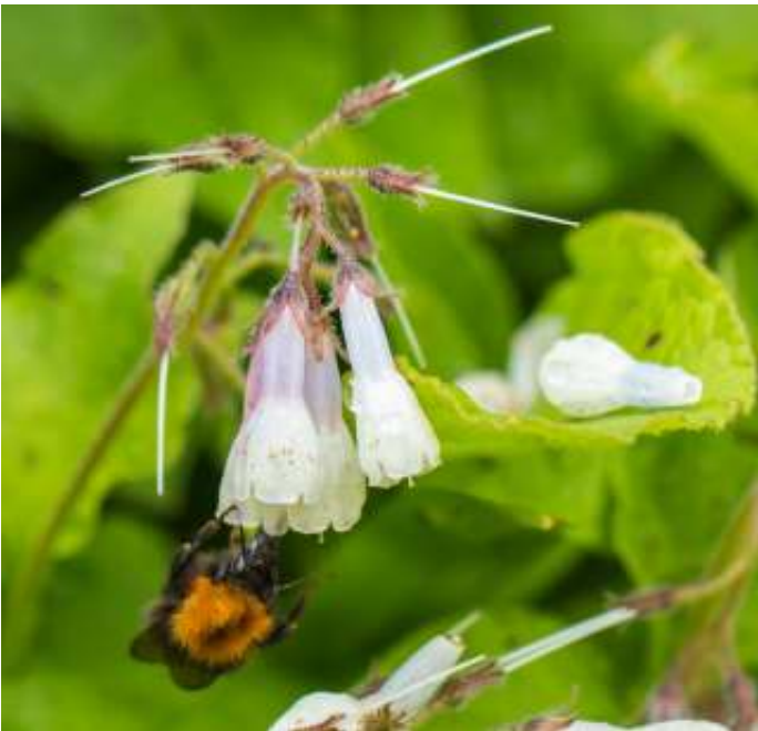
Akkerhommel met Smeerwortel

We hebben als KNNV onder meer aangegeven dat er meer bloemrijke bermen en akkerranden moeten komen om de biodiversiteit te vergroten. Dit is belangrijk voor behoud en de ontwikkeling van verschillende planten en dieren.