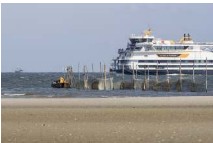
Met de boot naar Texel

Inlichtingen: Fred Weel, M: 06 48 66 40 25, E: fredweelroop@ziggo.nl.