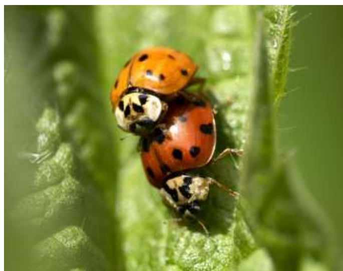
7-stippelig lieveheersbeestje