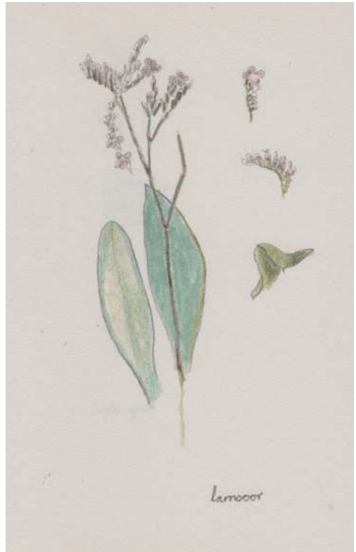
Lamsoor, tekening: Anita Botman