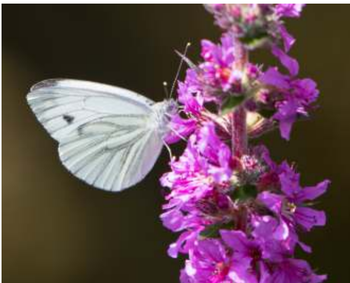
Klein geaderd witje

Maar we starten met een kennisquiz. Hoe staat het met jullie kennis van Nederlandse orchideeën?