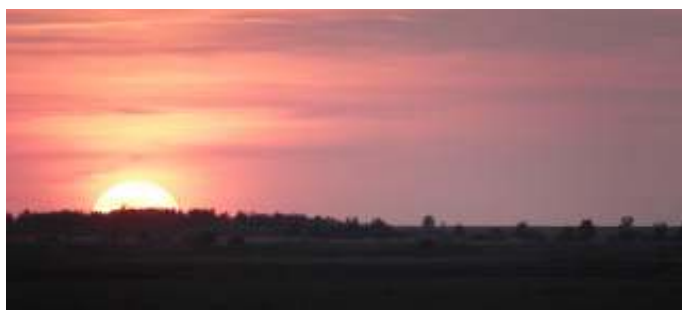
Ondergaande zon Oostvaardersplassen