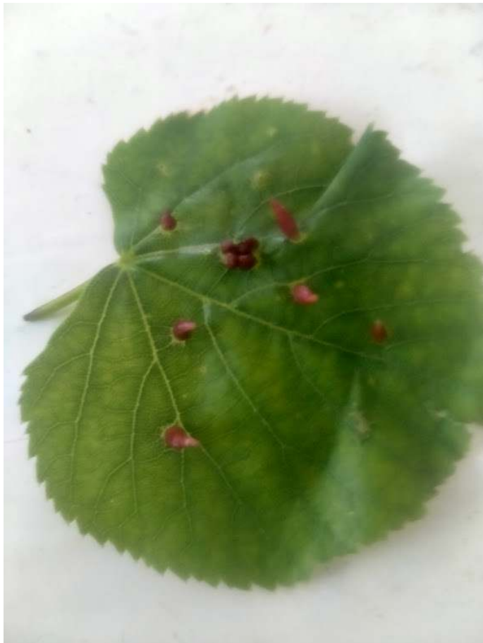
Gal op blad, foto: Anneloes ter Horst

We gaan het weer eens over grassen hebben. Verschillende mensen van onze groep hebben een online cursus 'grassen' van Floron gevolgd, heel leerzaam, hoewel het wel erg veel is om meteen te onthouden. Veel materiaal hiervan is ook goed te gebruiken voor ons, dus dat gaan we deze middag doen. Het is wel fijn als er ook wat grassen zijn om ter plekke mee te oefenen; neem wat mee, liefst bloeiend, maar dat hoeft niet persé.