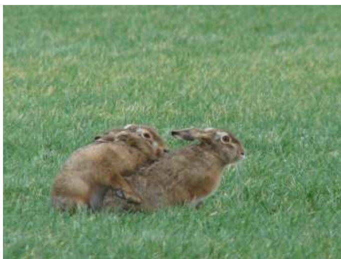
Kop staart bots, foto: Douwe Greydanus