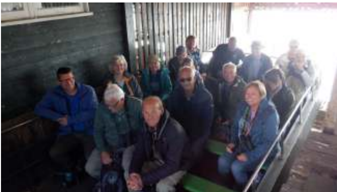
Klaar voor de start