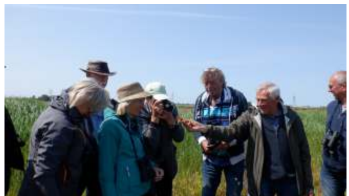
Alle ogen zijn gericht, foto: Ab van Dorp