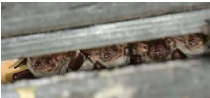
Meervleermuizen Egboetje