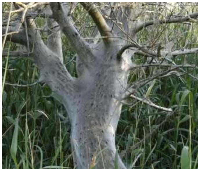
Wilg met Wilgenspinselmot

Rijdend naar Almere bezoeken we de eerste kijkhut. Een Atalanta gaat ons voor. Via het kronkelende, spookachtige of sprookjesachtige pad, langs de door de Wilgenspinselmot wit ingepakte Wilgen en langs de prachtige bloemschermen van de Vlier komen we bij een vogelhut. De Zwaluwen komen ons al tegemoet, druk foeragerend. Wat een nesten in de nok. Op het water veel ruiende Grauwe ganzen.