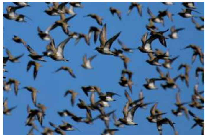
Groep vogels Zeevang, foto: Ben Pronk

Ben Pronk, M: 06 124 25 629, E: benpronk1955@gmail.com.