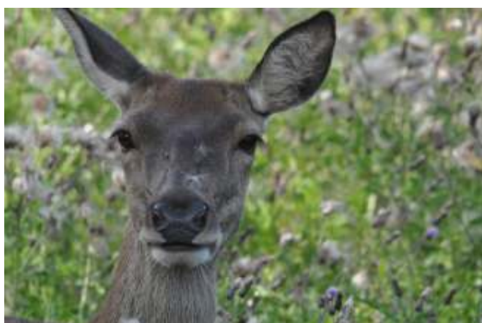
Ree, foto: Fred Weel