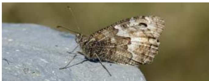
Heivlinder, foto: Henny v.d. Groep

In verband met weersomstandigheden kan een activiteit niet door gaan. Iedereen die zich heeft aangemeld krijgt bericht als het niet door gaat. Informeer bij twijfel bij Ad Roobeek.