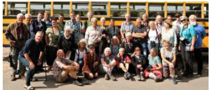
Excursie naar Texel