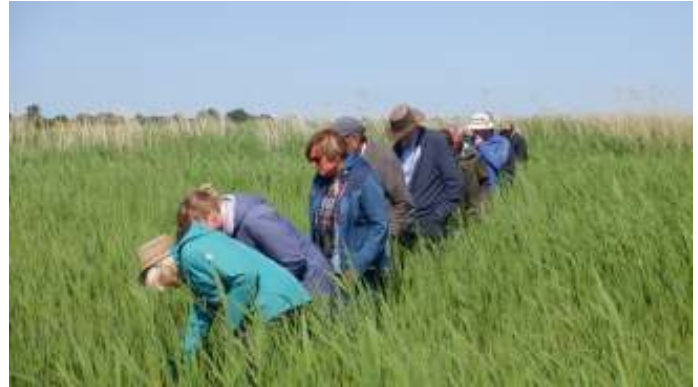
Wat groeit daar?