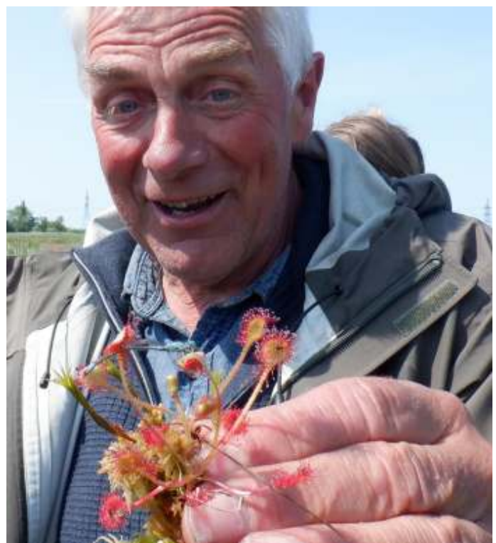
Een juffer verstrikt geraakt in de Zonnedauw