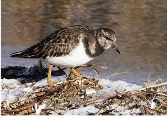
Steenloper op zoek naar voedsel