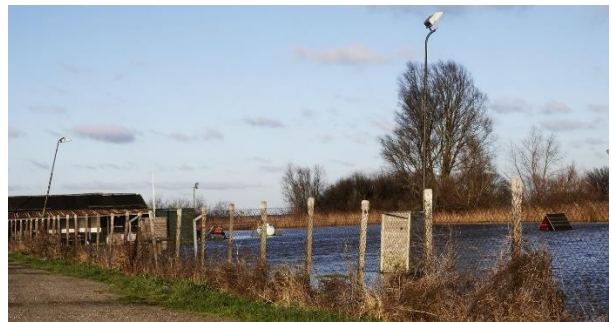
Honden club buitendijks

Blijf met je handen af van buitendijkse of uiterwaardse gebieden.