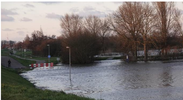
Nesbos parkeerplaats onderwater

De laatste tijd heeft u wel gelezen en misschien aan den lijve ondervonden dat er maatregelen moeten worden getroffen tegen het wassende water. Indertijd wilde men buitendijks en in de uiterwaarden woningen gaan bouwen. Op je klompen kun je aanvoelen dat zoiets voor bewoners problemen kunnen gaan opleveren en wie dekt de schade?