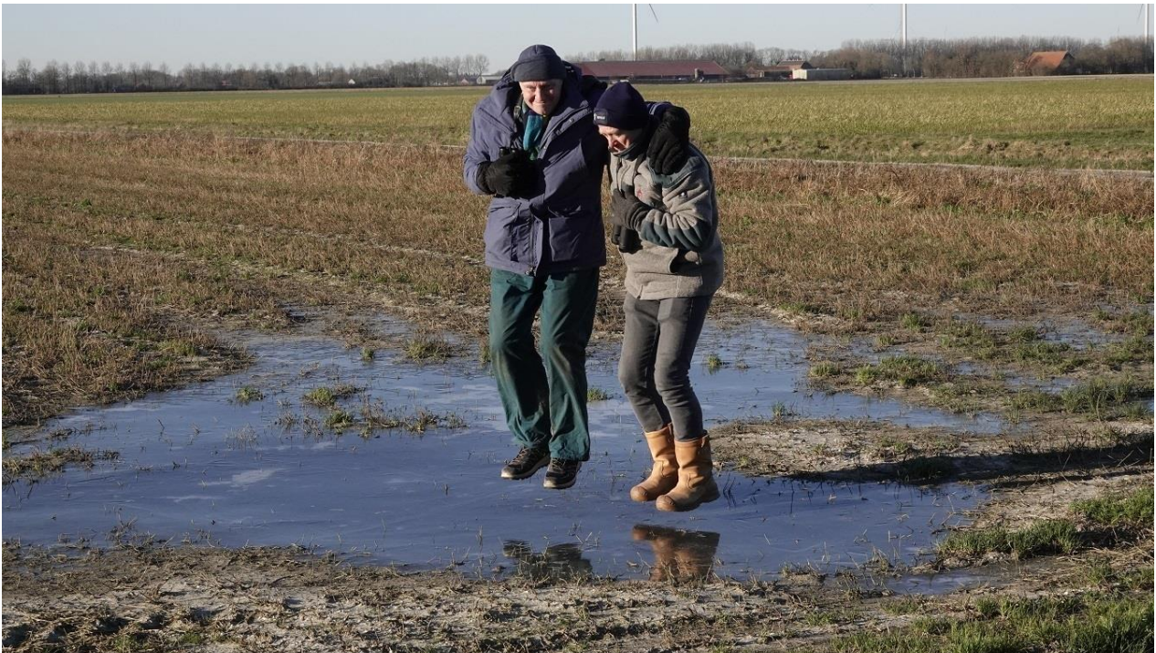
Hoger heren ...

Met dit winterse weer werden er weer meer IJsvogels gezien. Openplekken in het aan groeiende ijs bood hun nog kans op voedsel. Op het hek bij de Koopmanspolder zat een te turen. Aan de andere kant van het molentje heb ik maar een bijt gemaakt zodat deze daar kan vissen. Gelukkig was het IJsselmeer open en vloog de IJsvogel daar regelmatig heen en weer om haar voedsel te spotten.