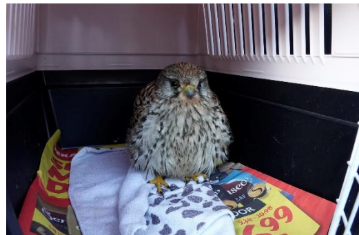
In de bens Bonte Piet

Via een app kreeg ik deze foto (links) op mijn mobieltje en dat zag ik om 21:40 uur. Gelijk terug geappt dat ik er aan zou komen, zet maar een doos klaar. Bij het bollenbedrijf ging de poort gelijk open en ja hoor daar tegen de deur zat de Torenvalk, keek ons aan en