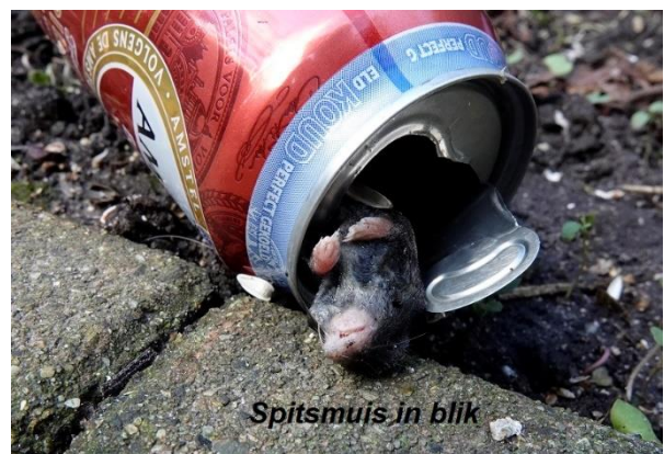
Spitsmujs in blik

Zoals u wel weet zijn plastic zakken, netten en drankblikjes dodelijk voor kleine dieren. Dat overkwam ook deze spitsmuis die er niet meer uit kon komen met leven latende gevolgen. Gelukkig dat er tegenwoordig statiegeld op blik zit er nu wel minder blik is te vinden maar een is al te veel.